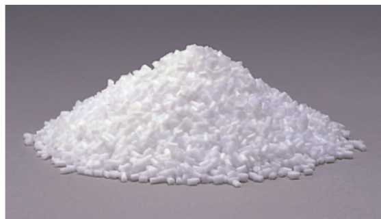
シリコンマスターペレット