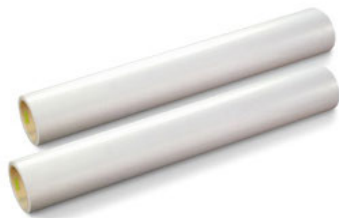
クリーニングテープ CLTXK/SL Series

粘着ローラーに付着したゴミを確実にクリーニングテープに転写させ、粘着ローラーをクリーンに保ちます。